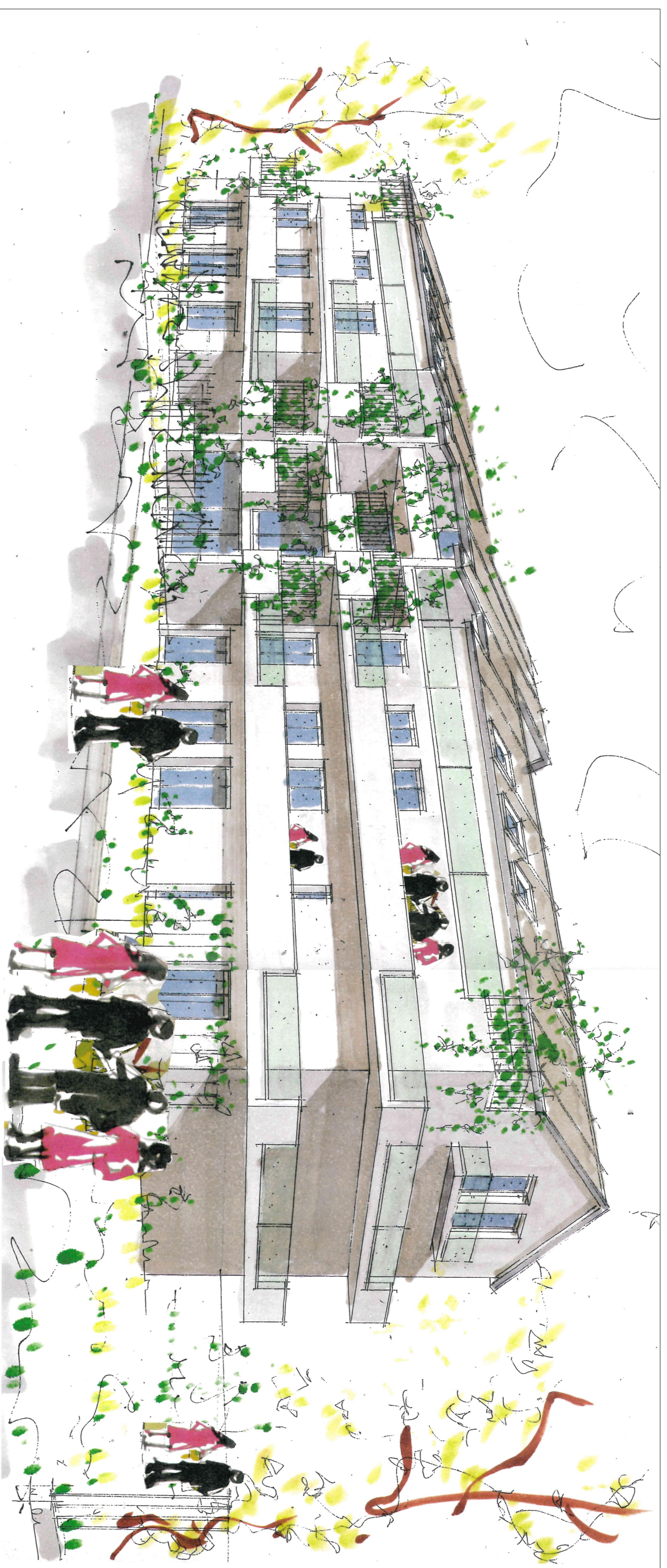
VISTA ENTRANDO DA VIA MEDICI