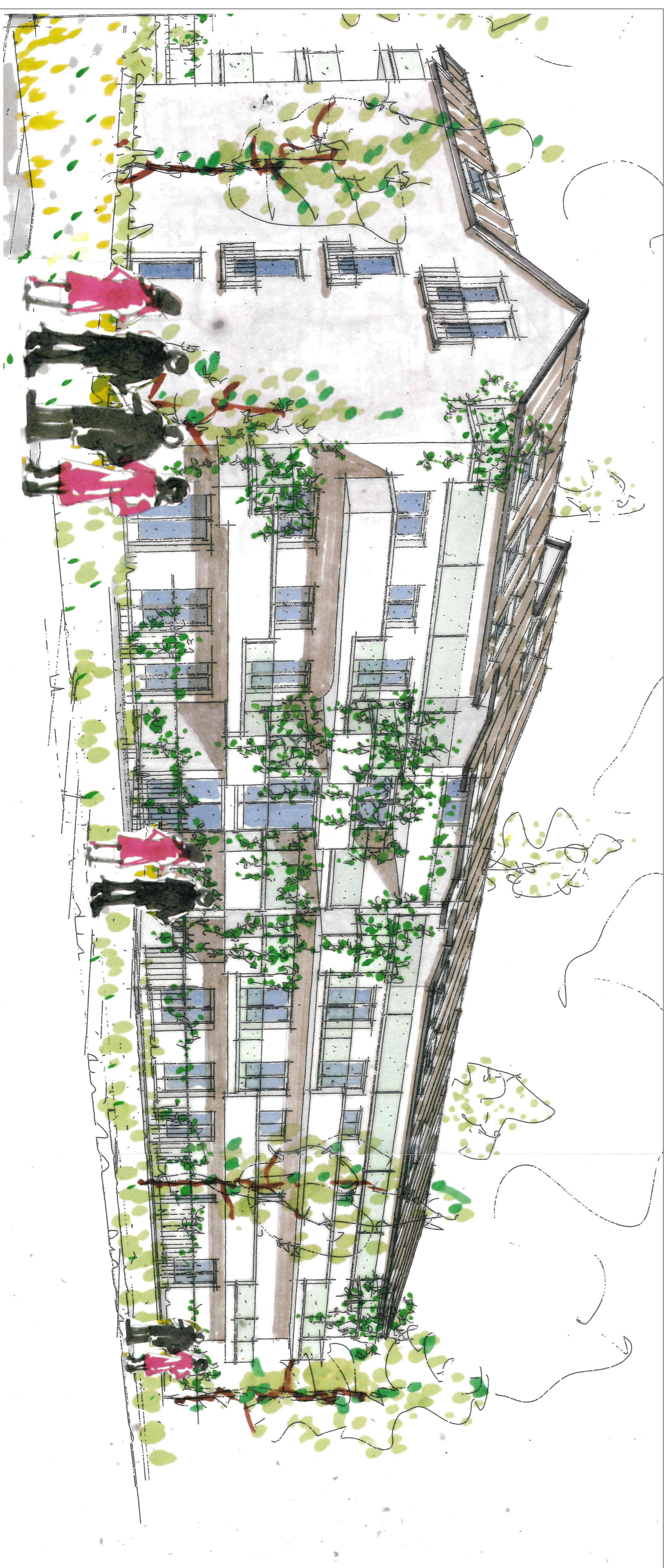
VISTA ENTRANDO DA VIA COL DI LANA