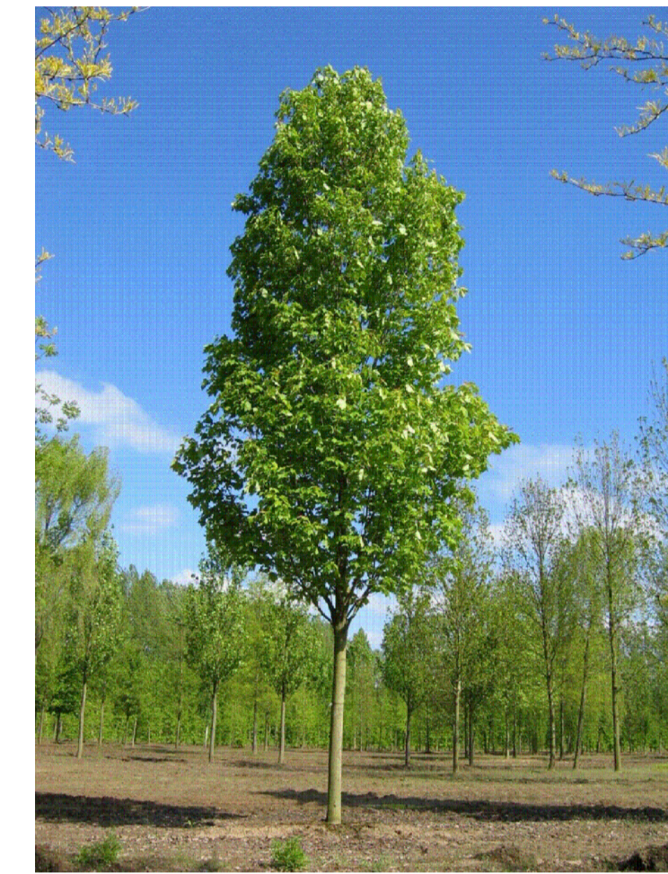
ACER RUBRUM SCANLON