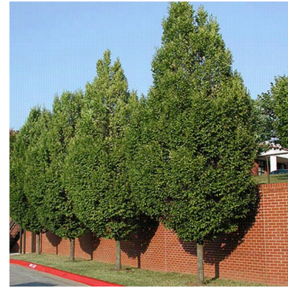
CARPINUS BETULUS PYRAMIDALYS