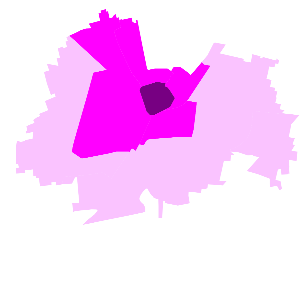
Zone I.C.I. aggregate per applicazione degli indici ■ 1 ■ 2 ■ 3