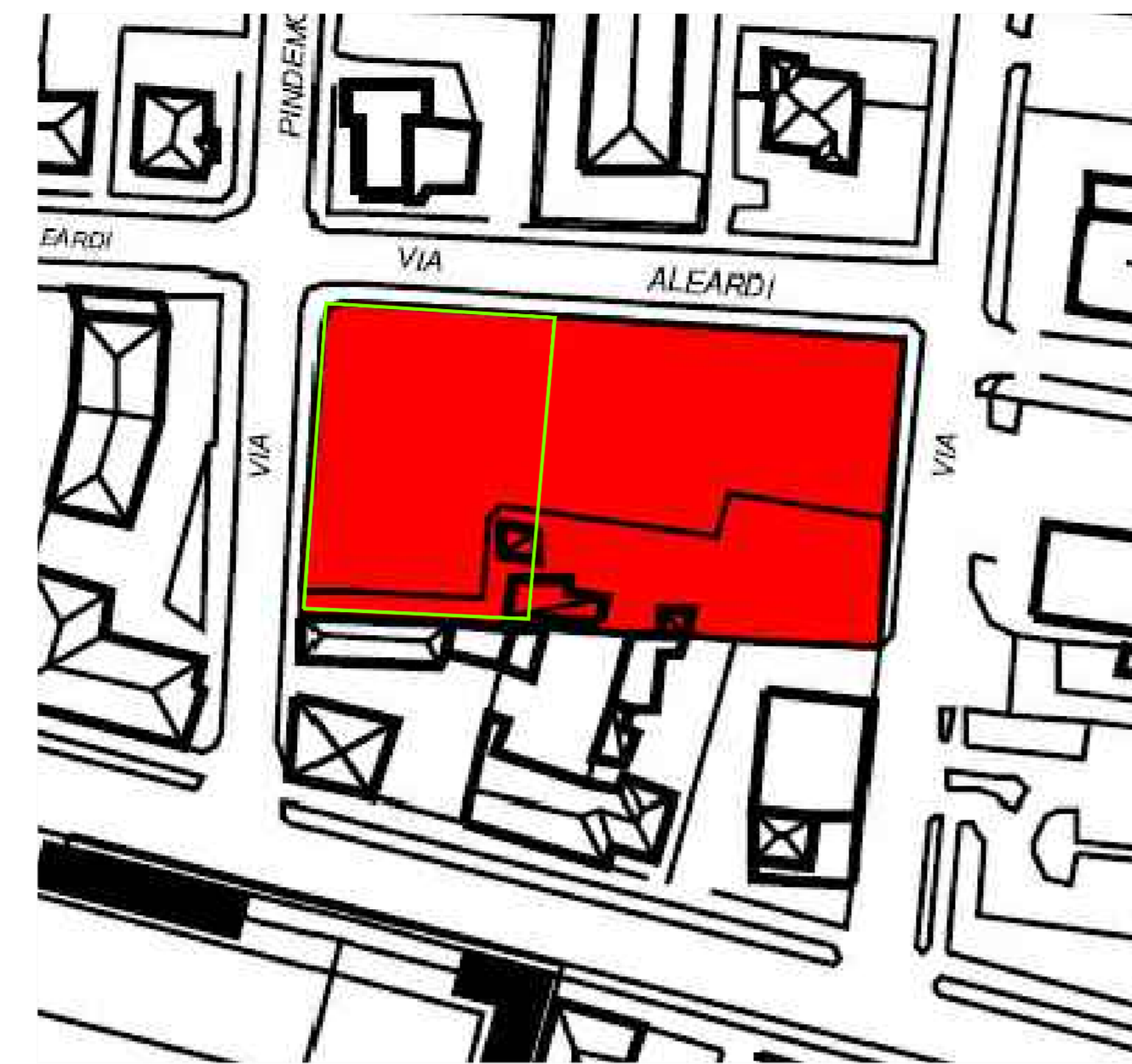
ESTRATTO P.G.T. VICENTE _ PIANO DELLE REGOLE TAV. C01_CRITERI DI PEREQUAZIONE Diritto edificatorio di perequazione Utp=0,30 mq/mq