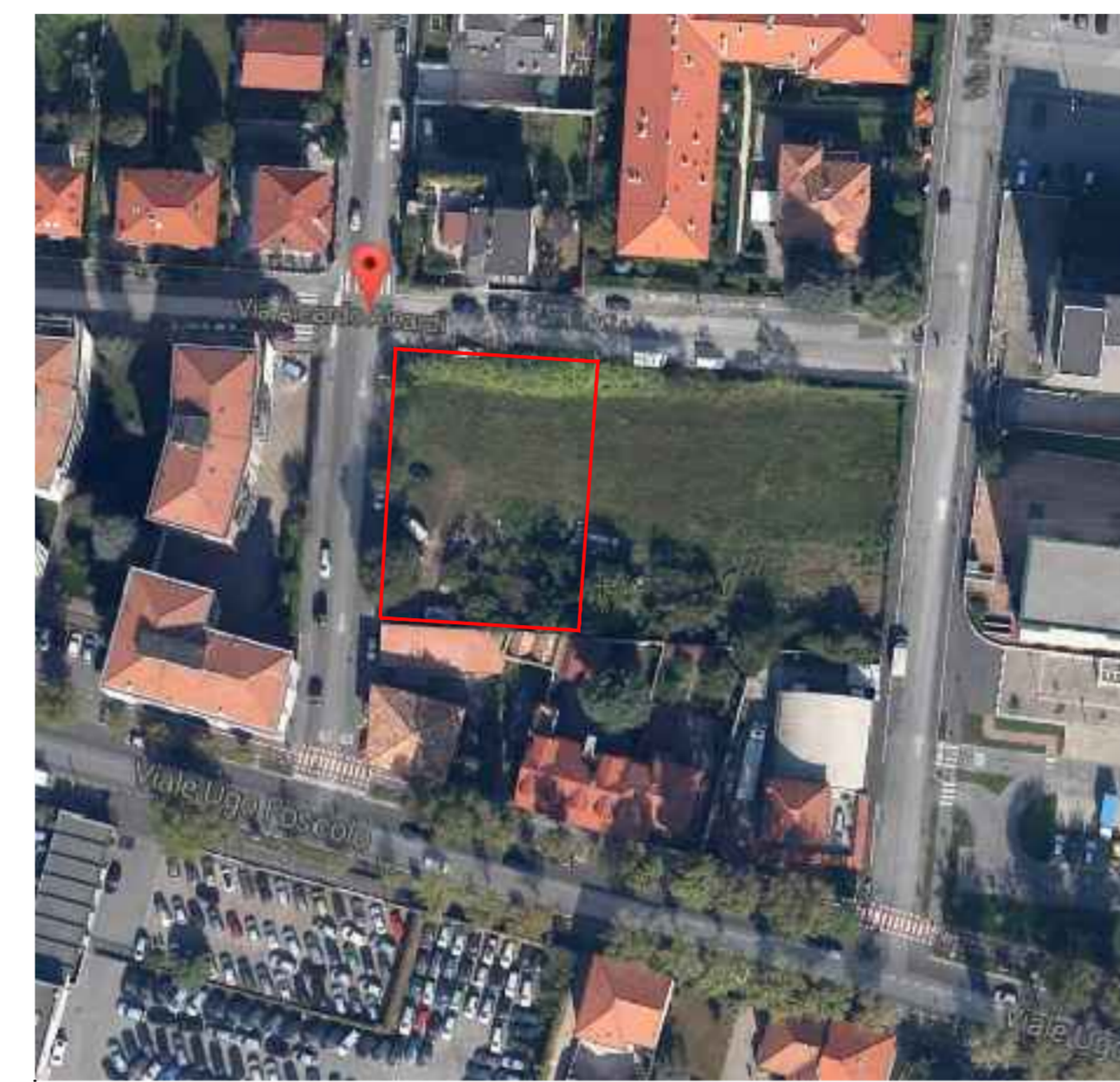
AREA PEREQUAZIONE AEROFOTO