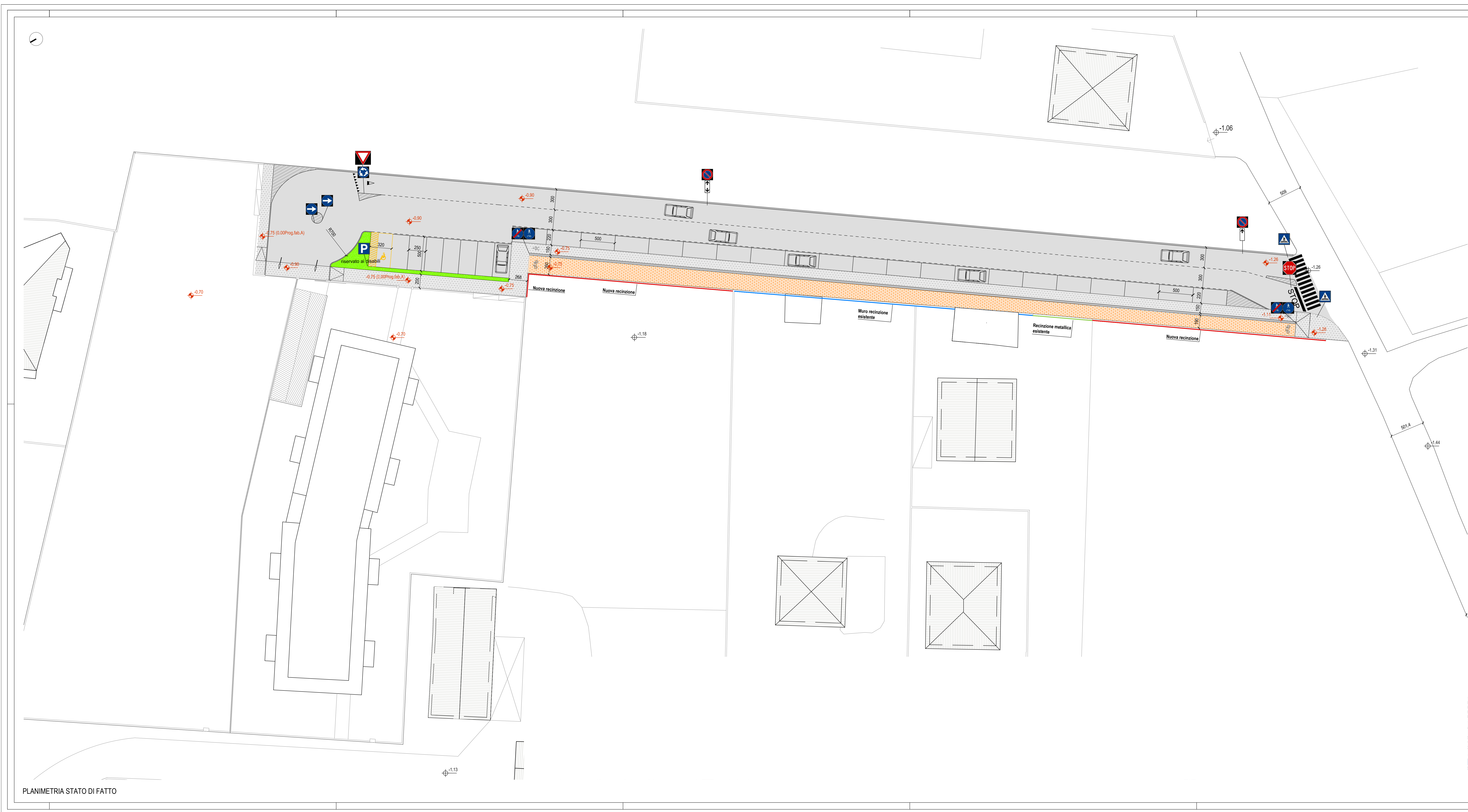
PLANIMETRIA STATO DI FATTO