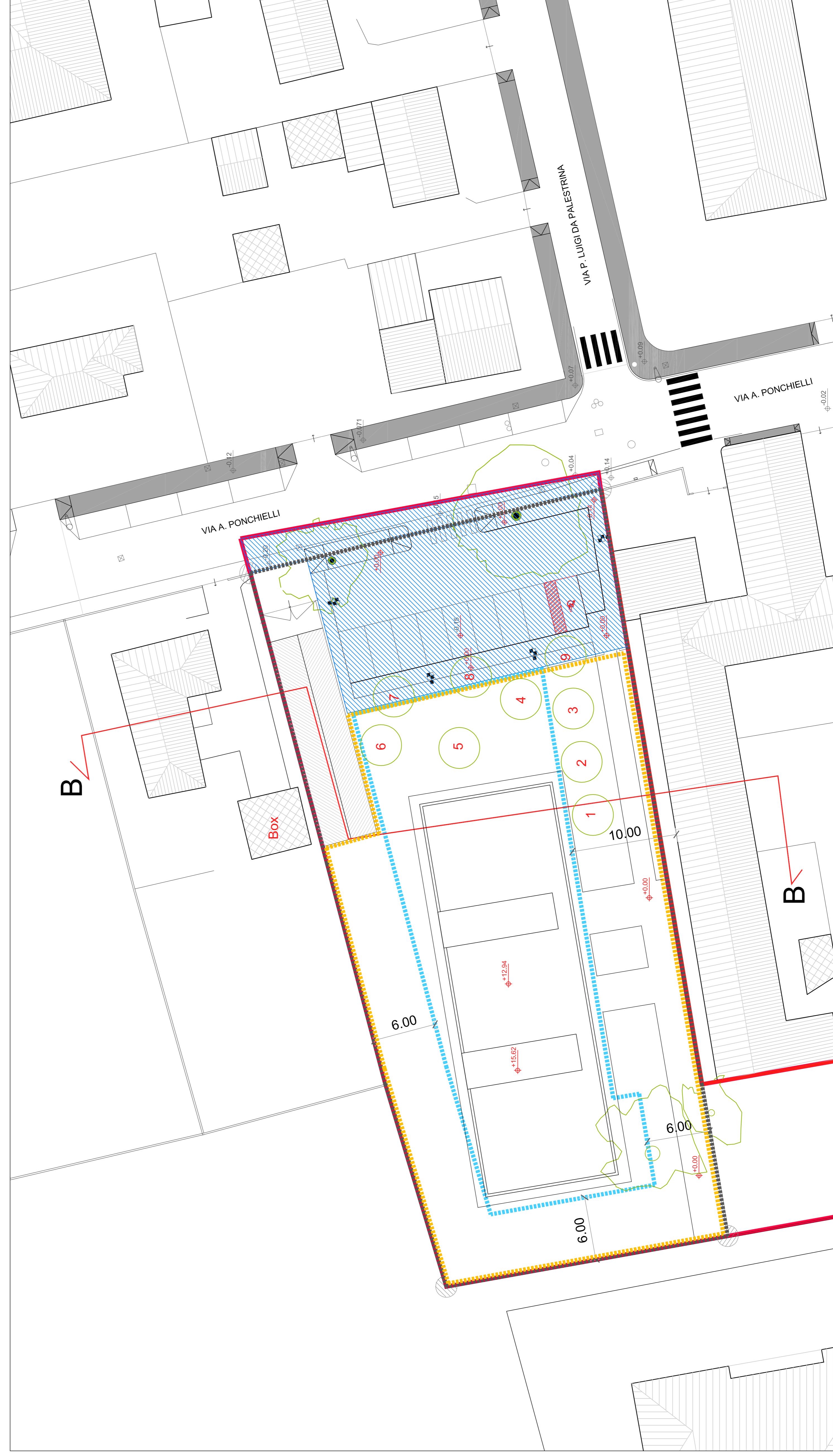
PLANIMETRIA SCALA 1:200