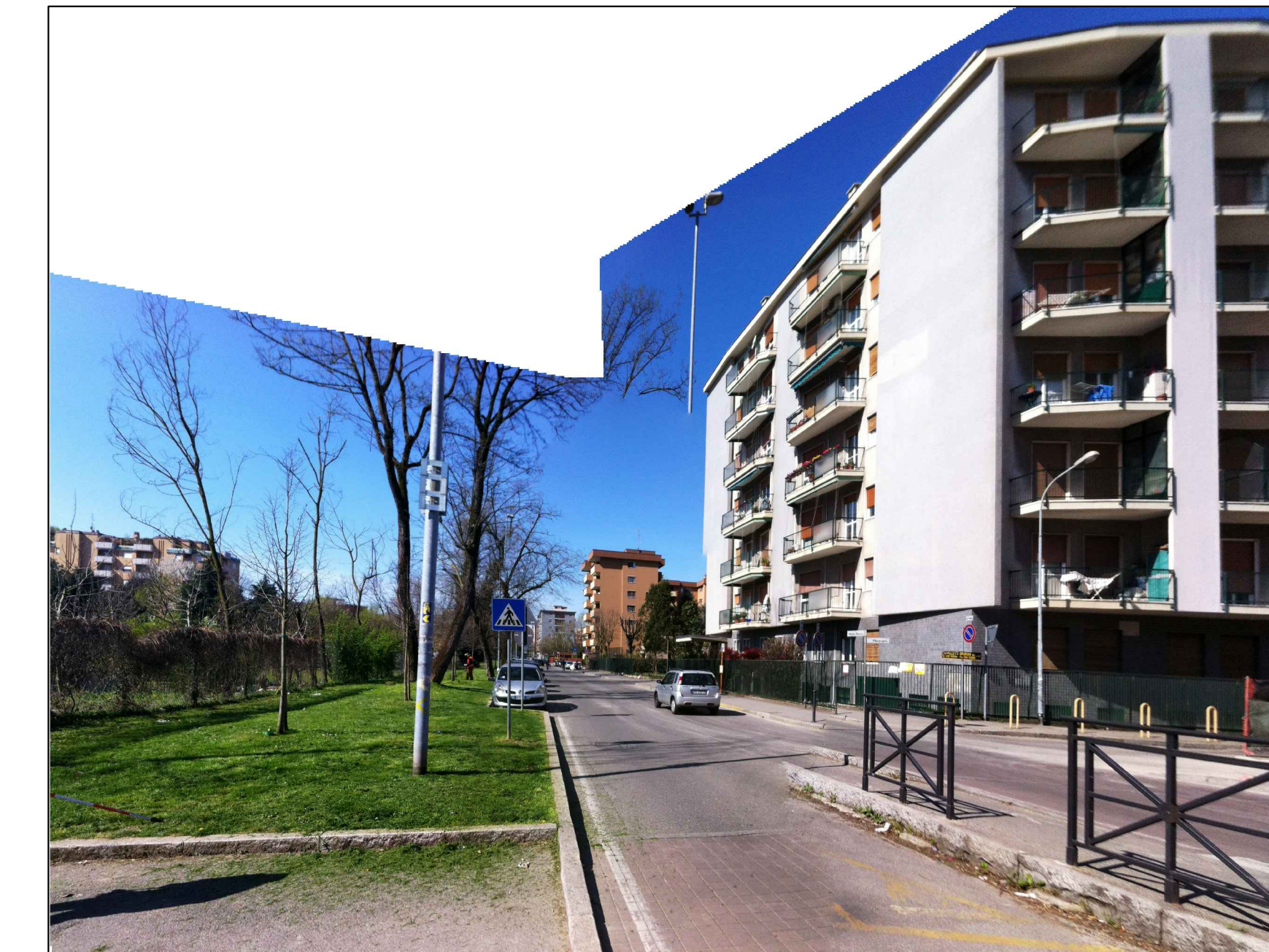
FOTO 3 - VISTA DALLA VIA A MONTE BIANCO