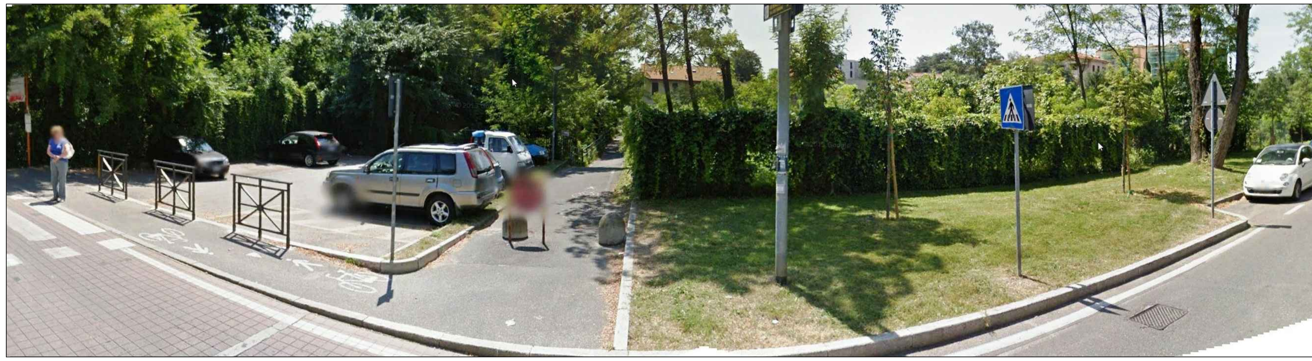
FOTO 1 - VIA MONTE BIANCO: VISTA VERSO PARCHEGGIO PUBBLICO ESISTENTE, PISTA CICLABILE, AREA ESTERNA PUBBLICA