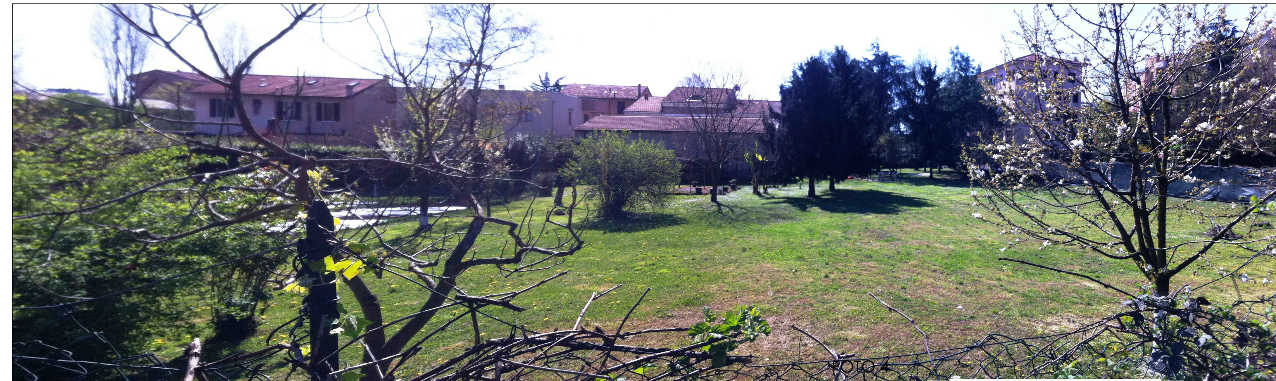
FOTO 4 - VISTA DAL TERRENO DI PROPRIETA'