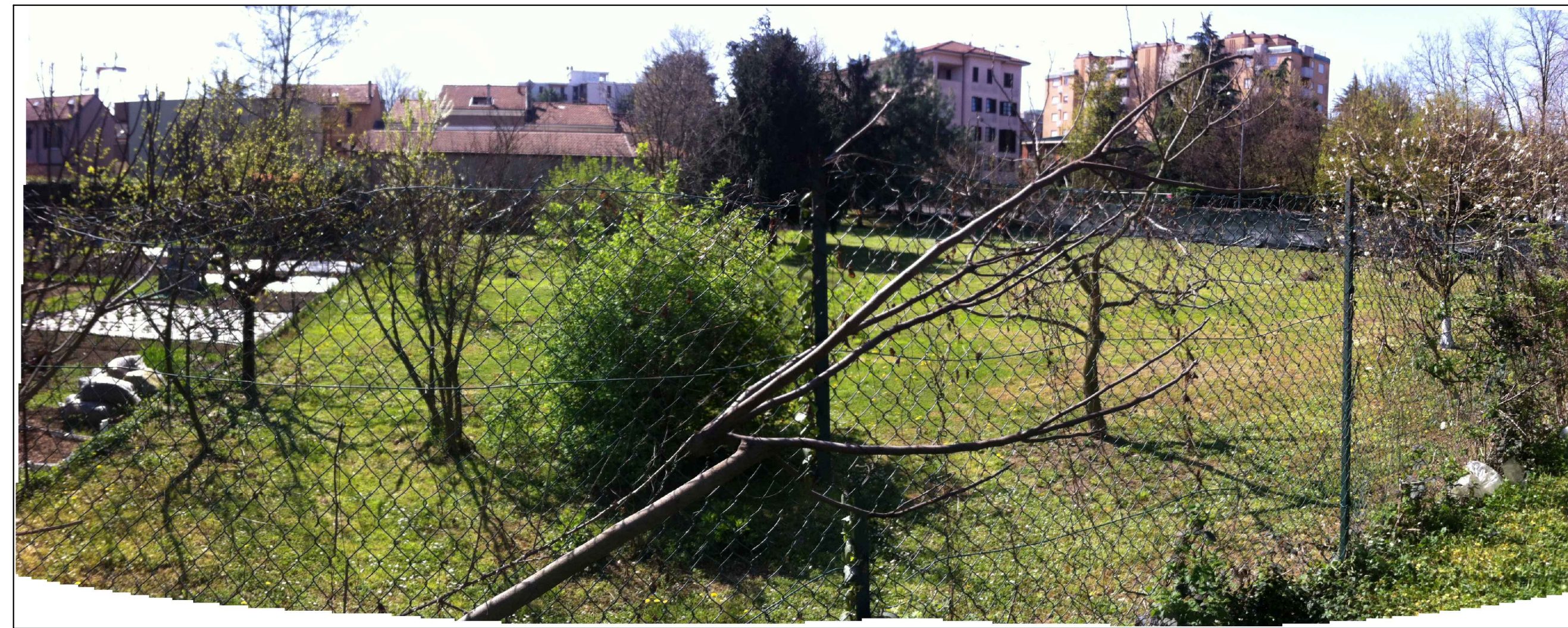
FOTO 5 - VISTA DAL TERRENO DI PROPRIETA'