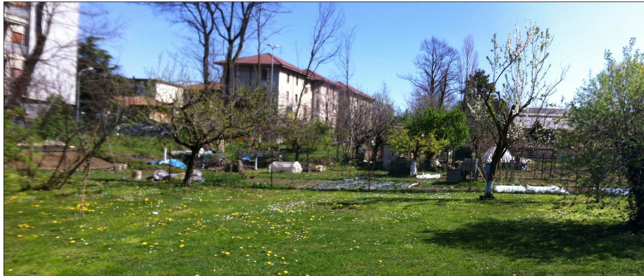
FOTO 6 - VISTA DAL TERRENO DI PROPRIETA'