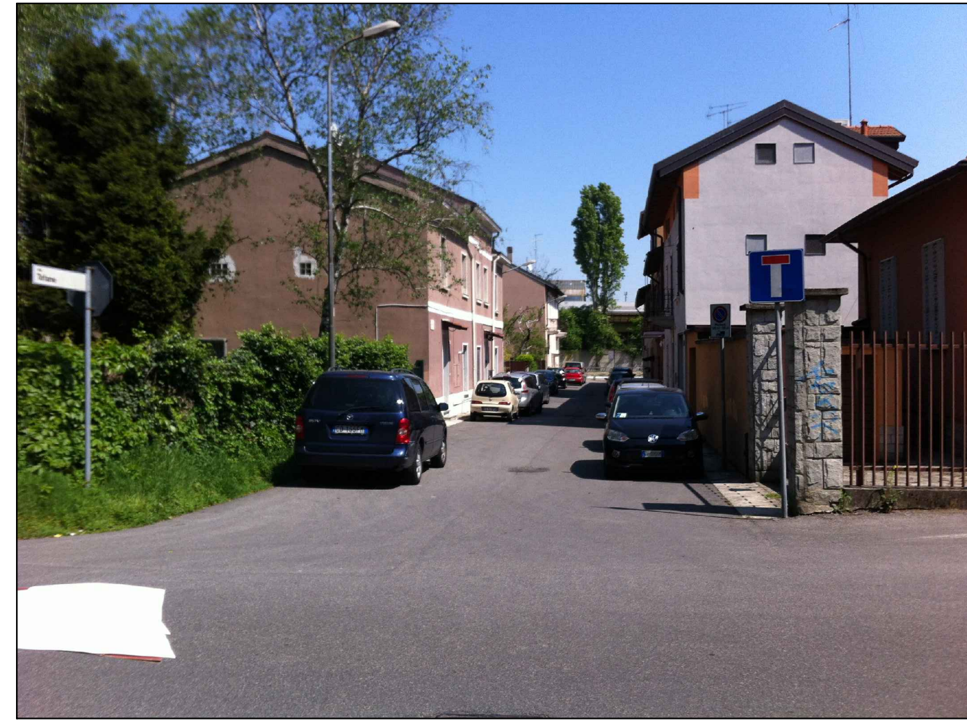
FOTO 8 - VISTA DALLA VIA TOFANE