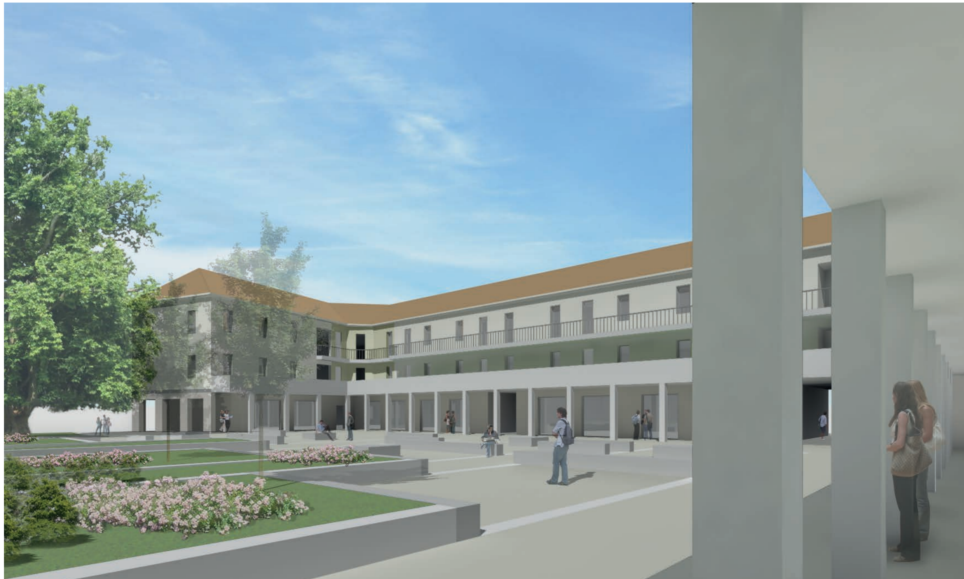
Vista prospettica della piazza