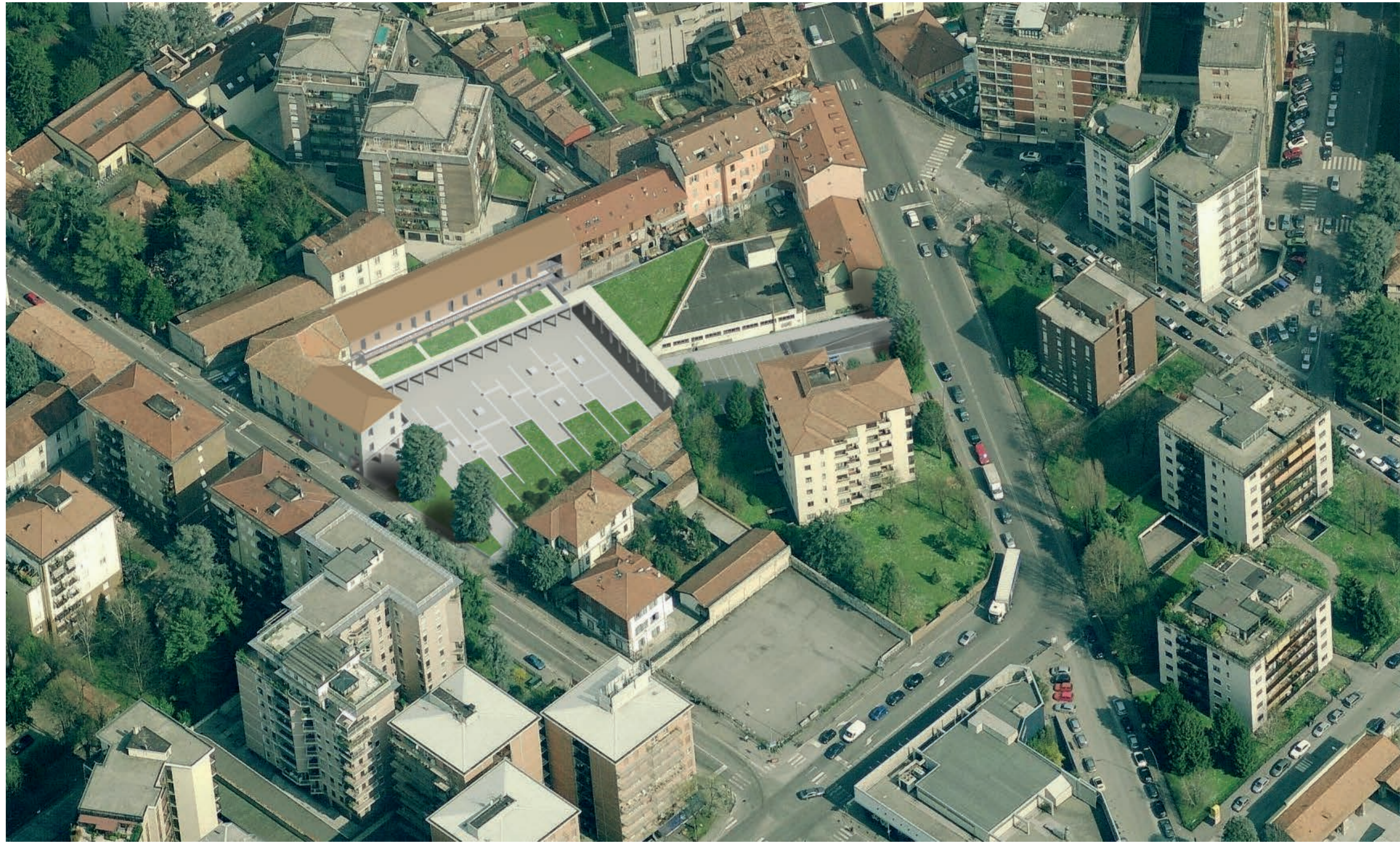
Fotoinserimento del progetto