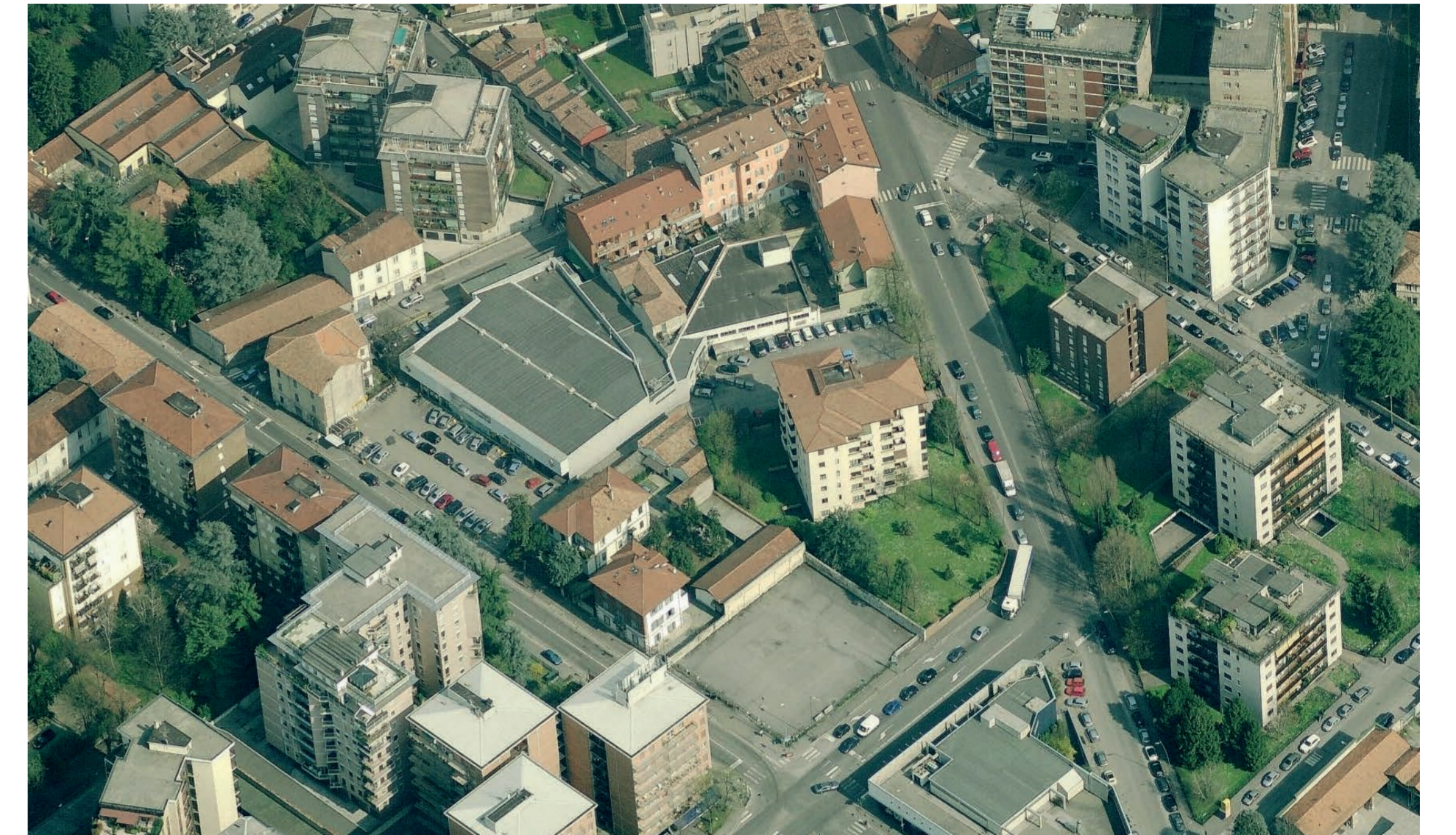
Vista aerea dell'area di progetto Stato di fatto