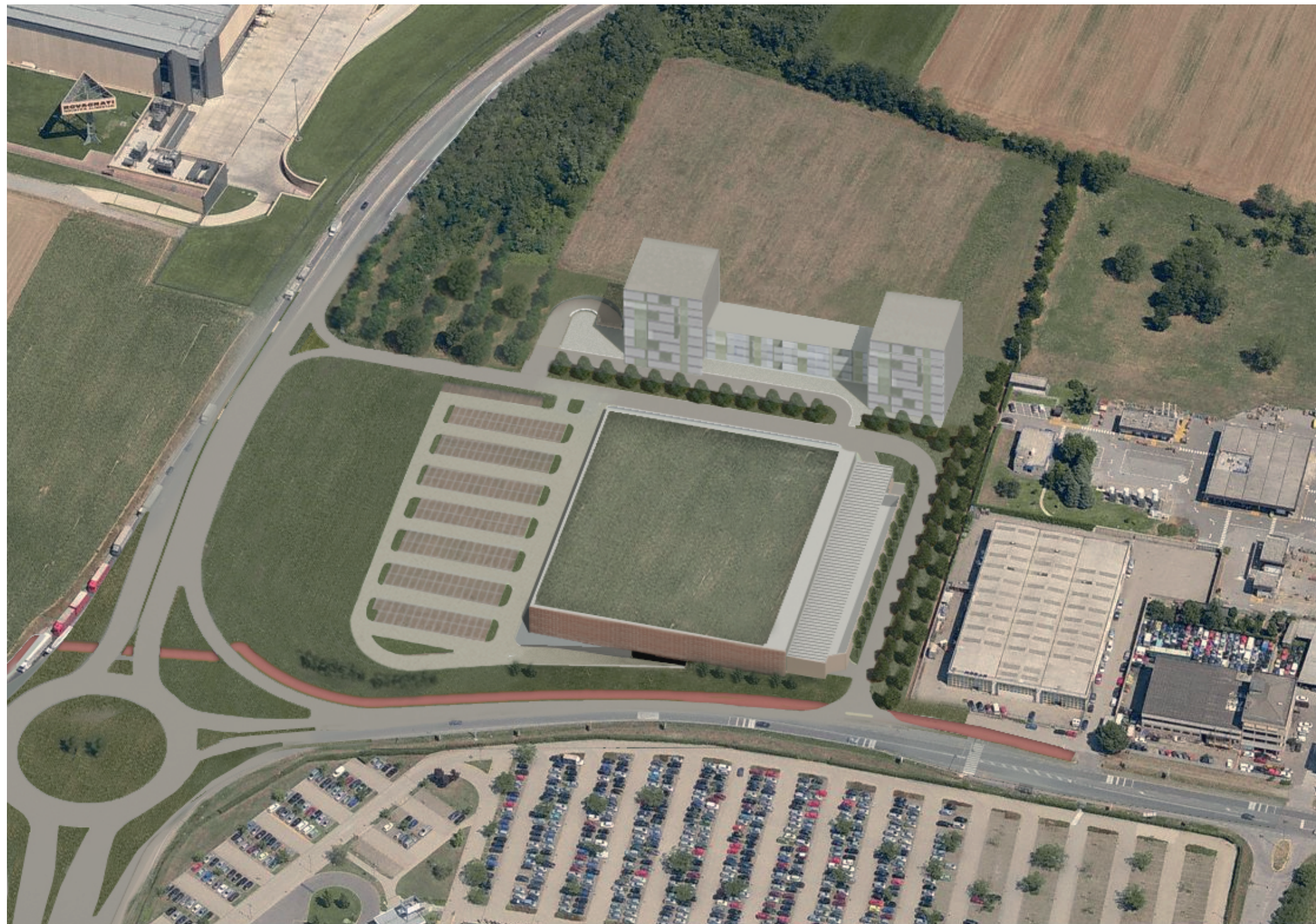
Fotoinserimento del progetto (1)