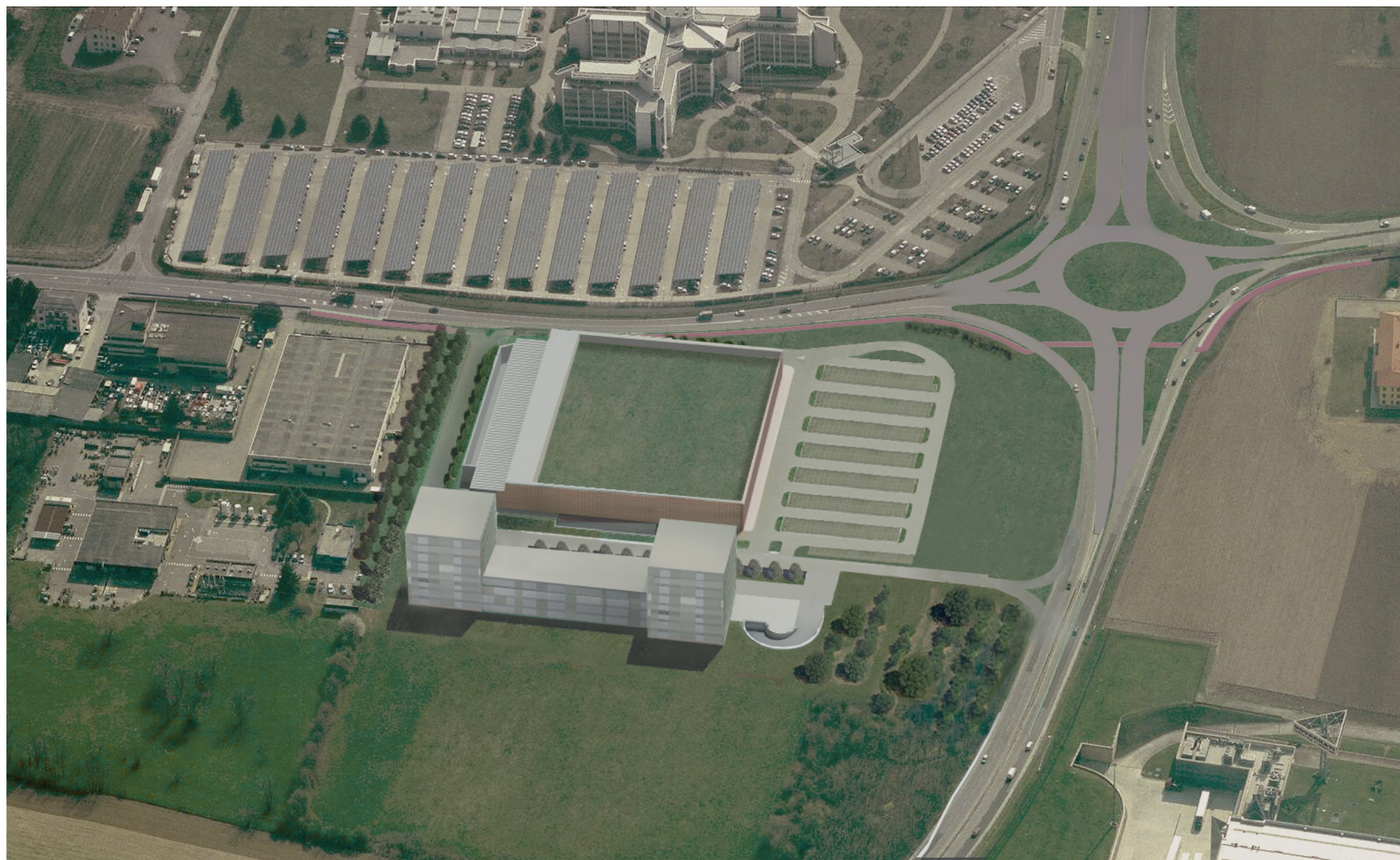
Fotoinserimento del progetto (2)