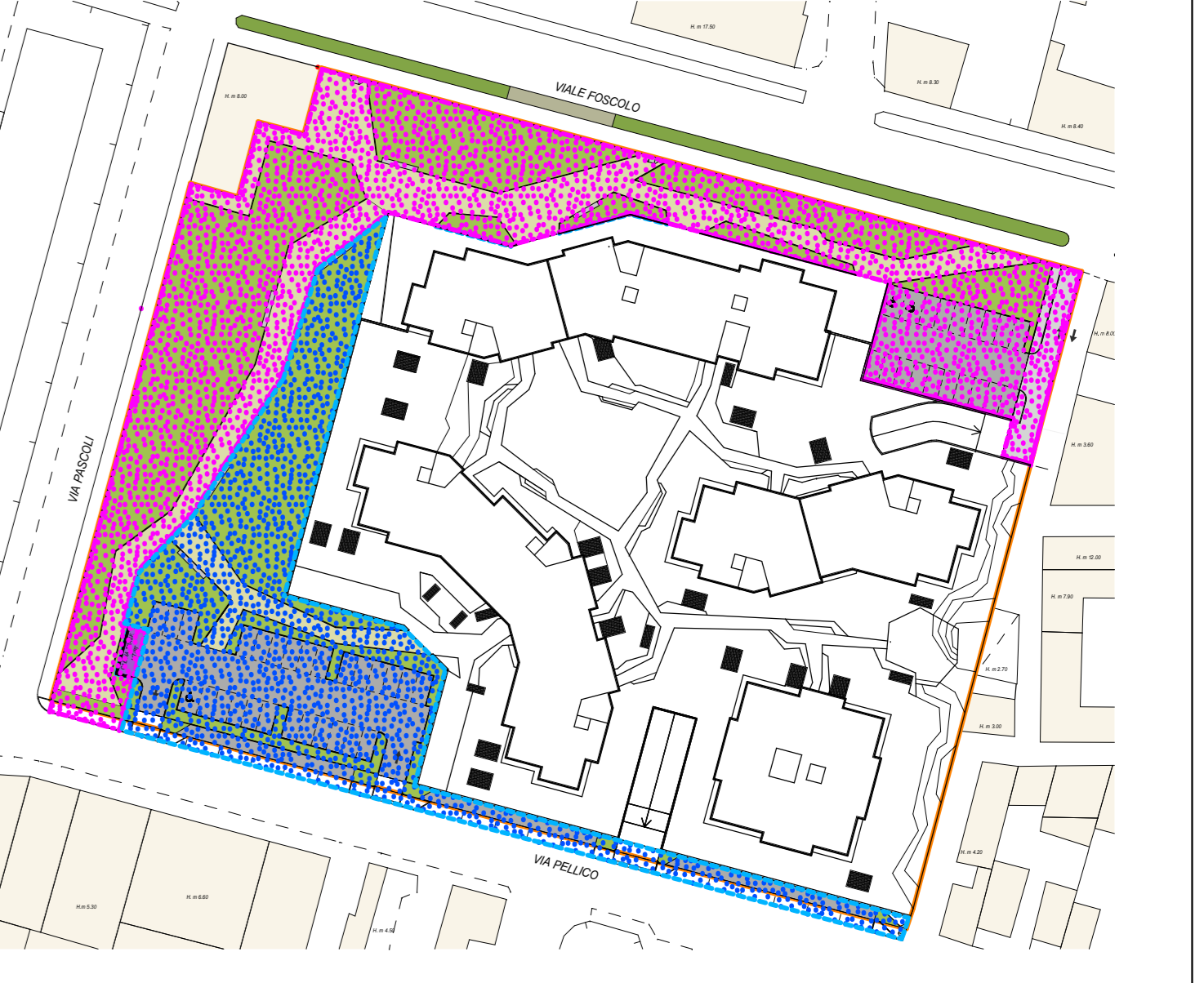
PLANIMETRIA DI RIFERIMENTO LOTTI URBANIZZAZIONI scala 1:1000 LOTTO A URBANIZZAZIONI LOTTO B URBANIZZAZIONI