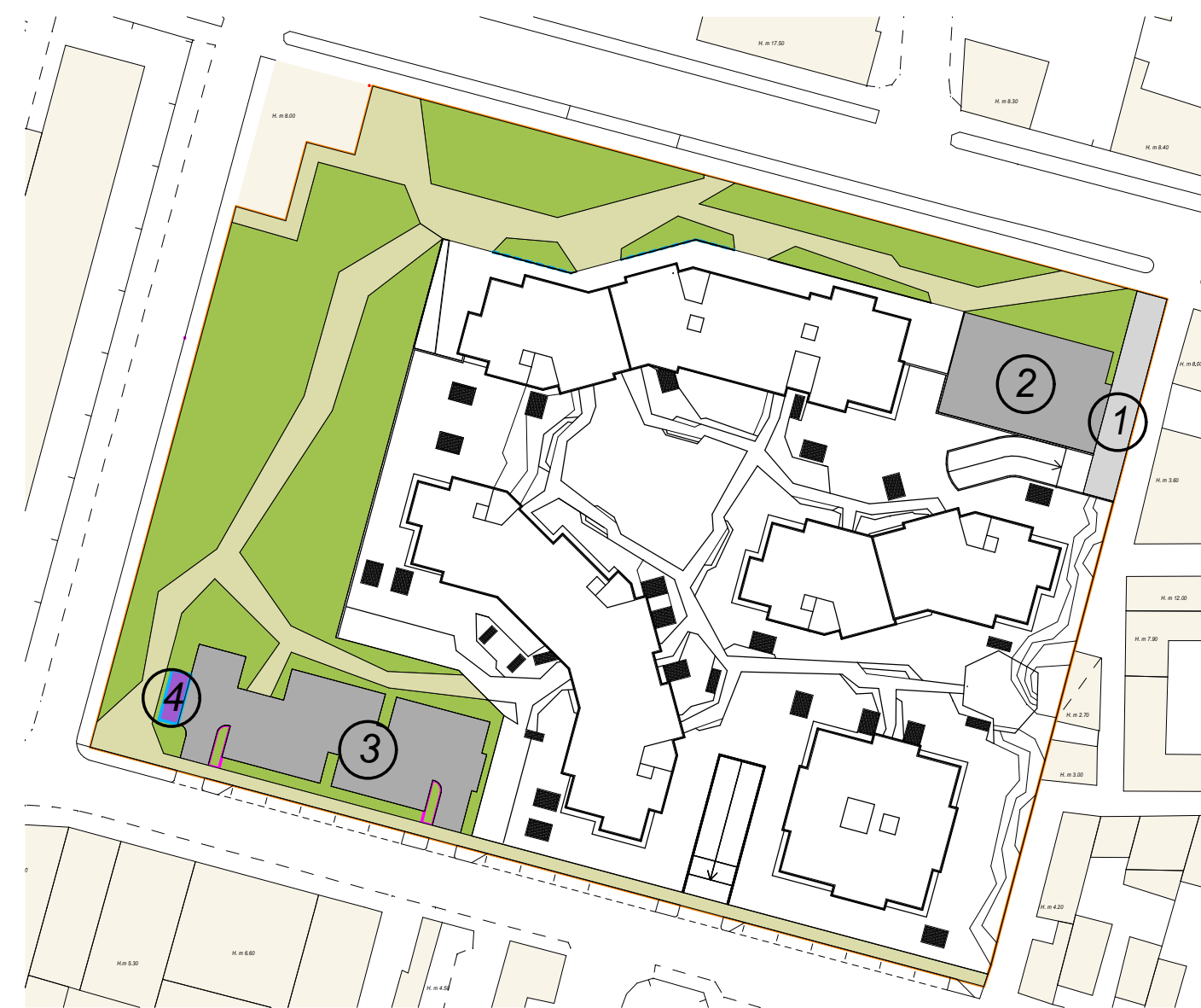
PLANIMETRIA DI RIFERIMENTO