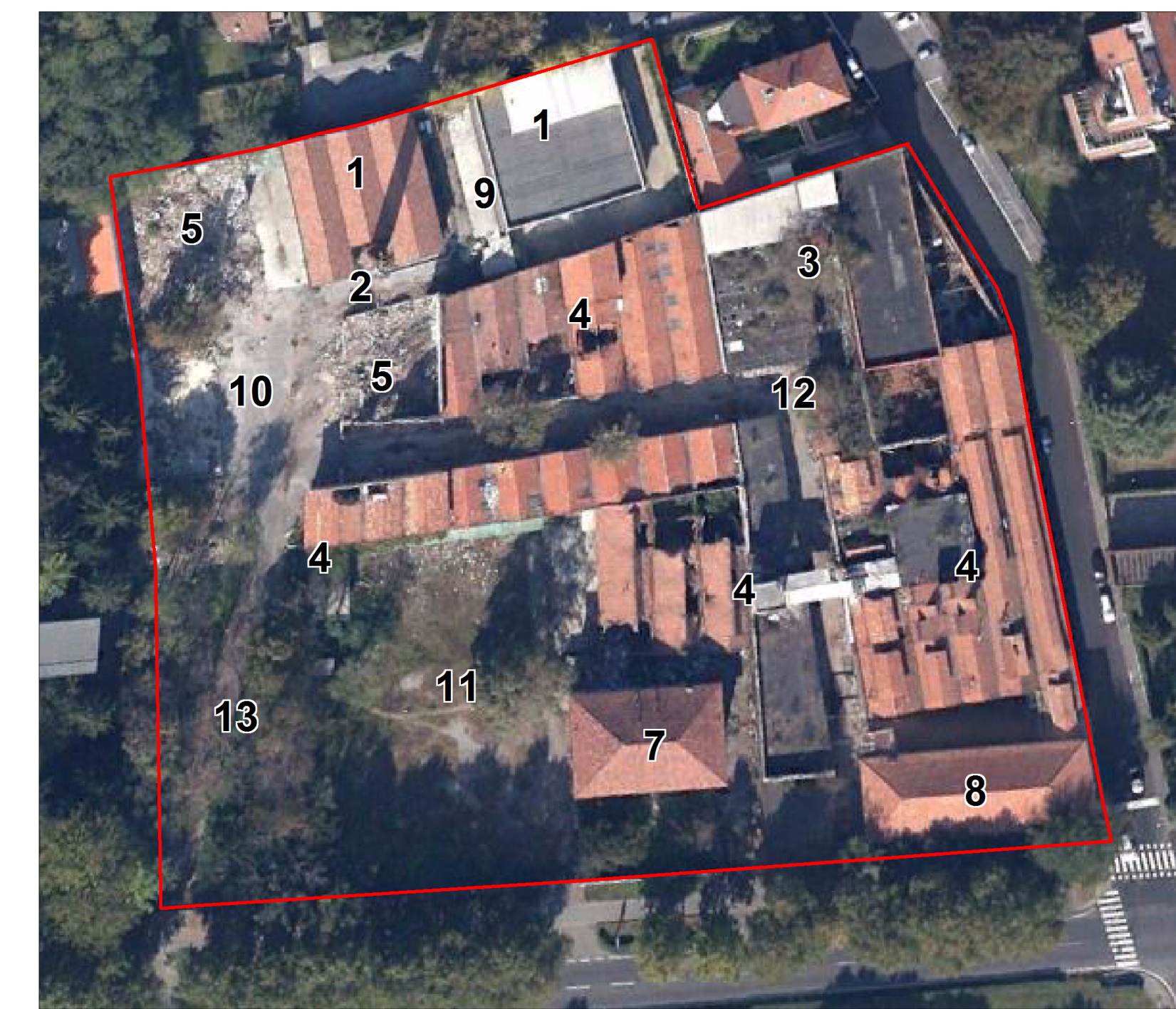
sopra: corrispondenza della tavola di stato di fatto con le strutture visibili al 2011