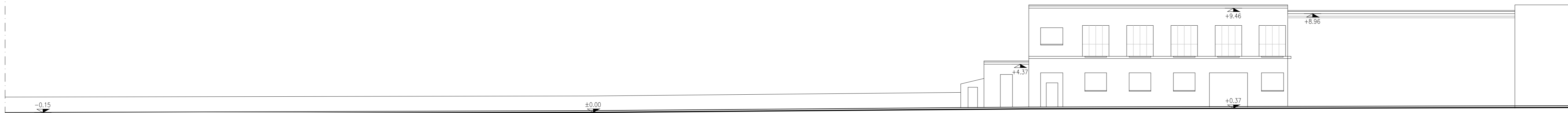
SEZIONE URBANA A-A' SU VIA GHILINI CON RILIEVO DEL FRONTE OPPOSTO ALL'INTERVENTO IN OGGETTO